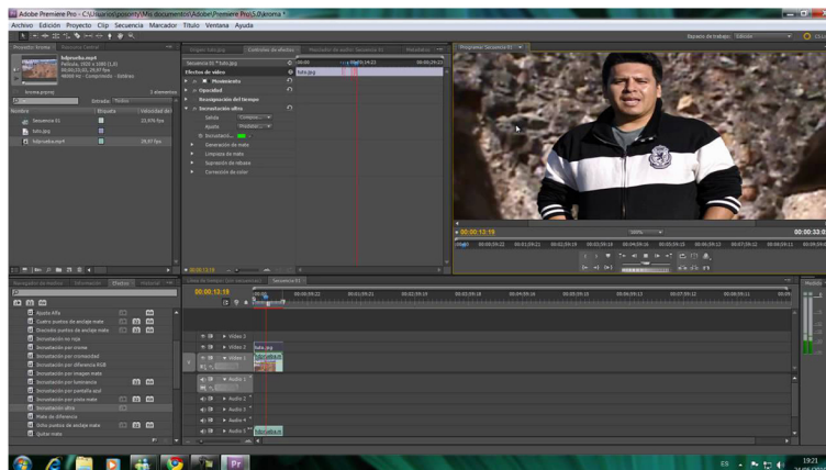
Esquema Adobe Premier (Windows i Mac)

S'ha de tenir en compte que tots els programes d'edició de vídeo tenen un esquema similar. Tots tenen el seu Timeline, Browser, Visor, etc. Poden variar la col·locació, colors, però en definitiva, la mecànica sempre és la mateixa, s'han d'importar els arxius que es volen fer servir, hi ha d'haver una línia del temps on col·locar els arxius per construir la història i s'ha de tenir un visor per veure els canvis que es produeixen en el Timeline.